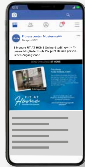
FACEBOOK & INSTAGRAM POST

Mit den im Startpaket enthaltenen Posts und Storys für Facebook und Instagram können Sie Ihre Mitglieder und Interessenten an Ihr Angebot „FIT AT HOME“ in regelmäßigen Abständen erinnern. Diese Bestandteile werden nicht individualisiert.