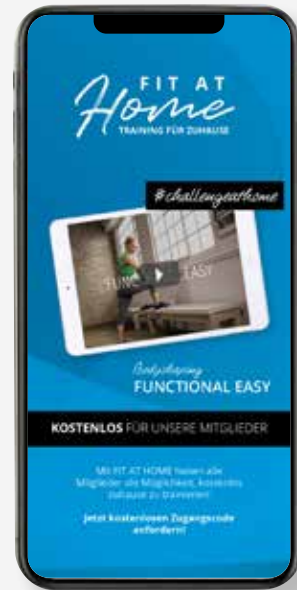
FACEBOOK & INSTAGRAM STORY